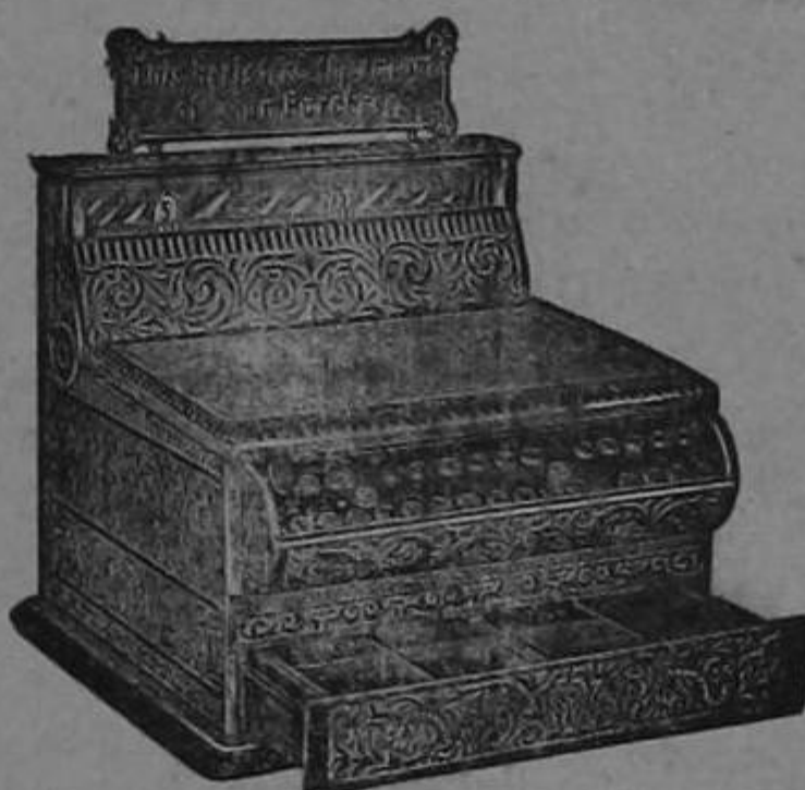
Para pormenores ocórrase á MACAYA Y Ca. — UNICOS AGENTES San José de Costa Rica

El aparato es en el exterior de lujoso metal niquelado y al registrar muestra al cliente el importe de su compra, anota el dinero que entra y lo suma automáticamente. La suma así imposible que pueda ser alterada pues queda bajo llave. El Aparato Registrador es una salvaguardia para el empleado honrado. Delata al dependiente infiel é impide toda tentación de sustraerse dinero. La sencillez de su mecanismo evita que se descomponga fácilmente. Todo aparato está garantizado y su precio relativamente equitativo recomienda su compra.